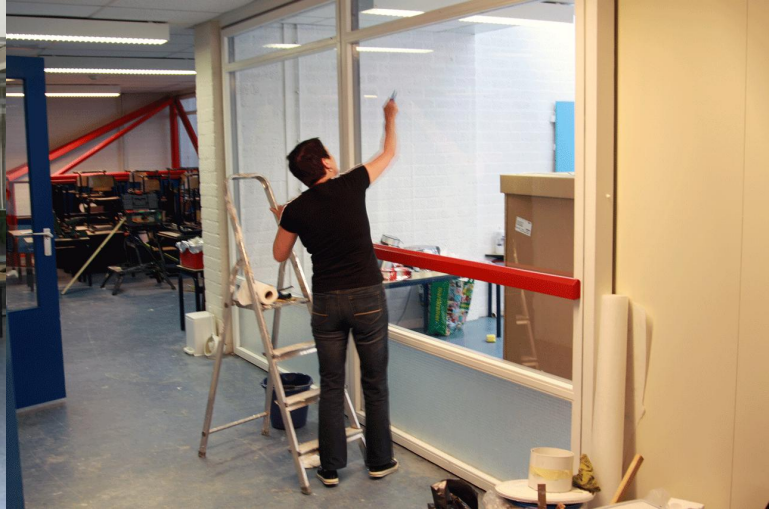
De ramen zijn weer schoon!

HET SCHOONMAKEN EN INRICHTEN IS BEGONNEN!! HIER EEN IMPRESSIE VAN DE WERKZAAMHEDEN, EEN AANTAL VAN DE VRIJWILLIGERS IN ACTIE!!