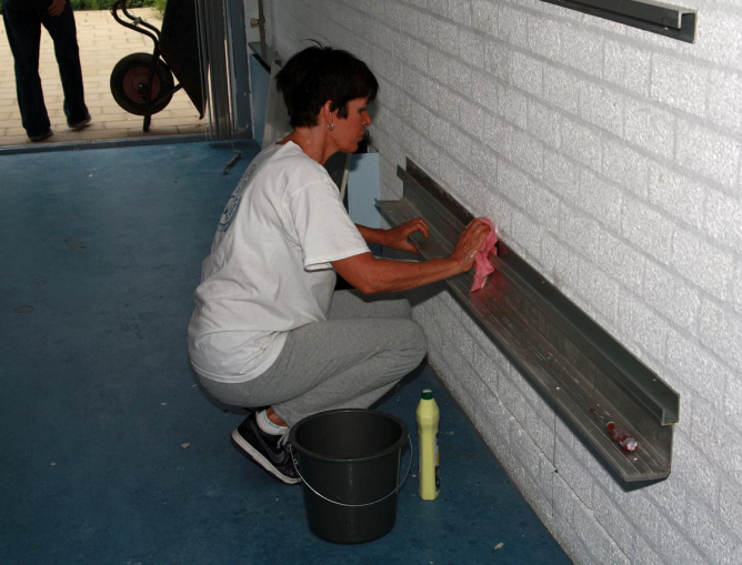
Het schoolbord wordt onder handen genomen!